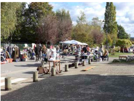
Octobre 2023 - Brocante