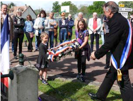
8 mai 2023 - Commémoration