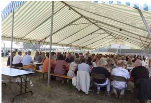
14 juillet 2023 - Fête Nationale