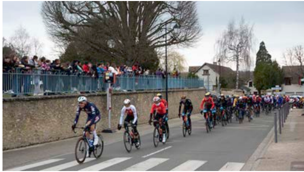
Mars 2023 - Paris Nice