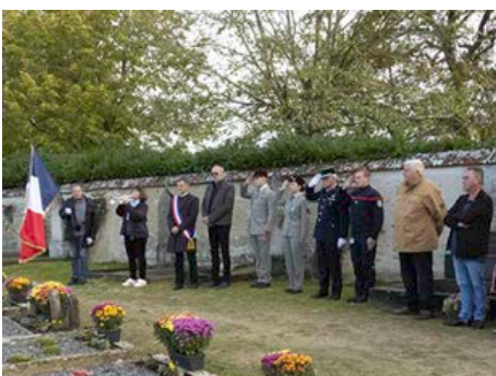
11 novembre 2023 - Commémoration