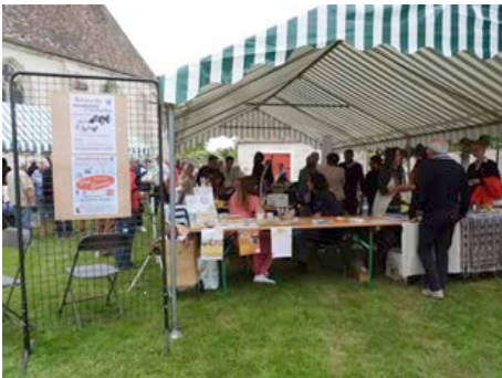
1er Septembre 2023 - Forum des Activités