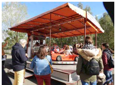
Octobre 2023 - Brocante