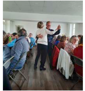
Avril 2023 - Repas des anciens