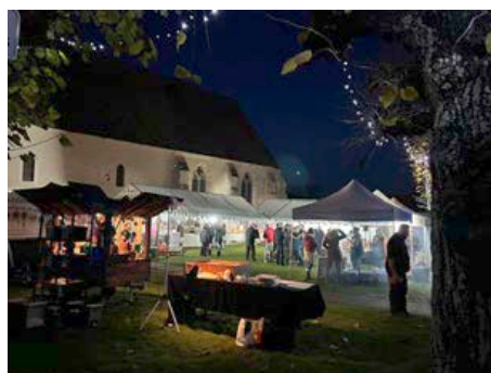
8 décembre 2023 - Marché de Noël