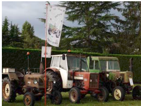
15 Septembre 2023 - Journées du Patrimoine