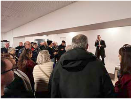
Janvier 2023 - Voeux du Maire