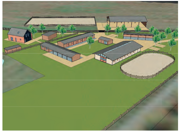
Implantation de la ferme au carrefour des routes des Sergontières et de la Boissière

Dans un souci d'esthétique et de bon voisinage, ces bâtiments seront construits en bois sur des structures en lamellé collés et installés au niveau de la route venant des Sergontières à 450 mètres de la première maison existante.