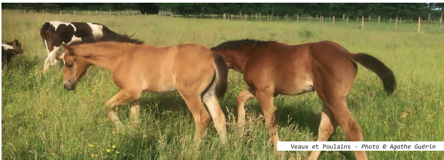
Veaux et Poulains - Photo © Agathe Guérin